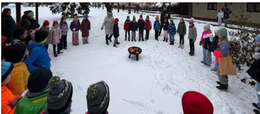
▲ Sorgen dem Feuer übergeben: Erstkommunionsvorbereitung am 21.02.