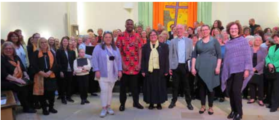
▲ Impression vom Frühlingsfest der Chöre aus dem letzten Jahr

Sechs Chöre begrüßen am 24.04. um 18 Uhr den Frühling in St. Severin. Das Motto dieses Jahr ist „Licht und Hoffnung“. Kommen Sie und genießen Sie das abwechslungsreiche Programm, das mit einem Megachor mit allen Sänger:innen endet. Danach gibt es ein gemütliches Zusammensein im Pfarrsaal. Wir freuen uns auf Ihren Besuch!